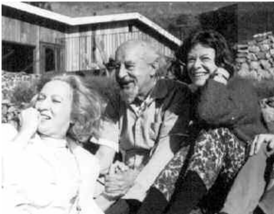
Gestalt terapiaren sortzaileak, Laura eta Fritz Perls, ezkerrean.

Nire esperientziaren arabera eta nire bulegoan ikusten dudaren arabera, terapiara datozen lagun askok pertsoneri laguntzen edo horiek hezten edo zaintzen lan egiten dute.